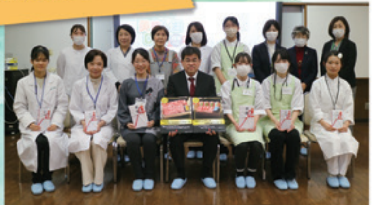
▲参加者・石川会長・審査員のみなさん。

審査では、「美味しさ」はもちろん「獨創性」や材料の入手のしやすさ・料理のしやすさといった「普及性」の点でも審査を行いました。