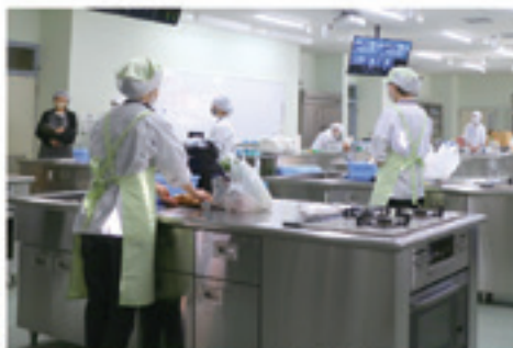
◀▲準備に取り掛かる参加者。