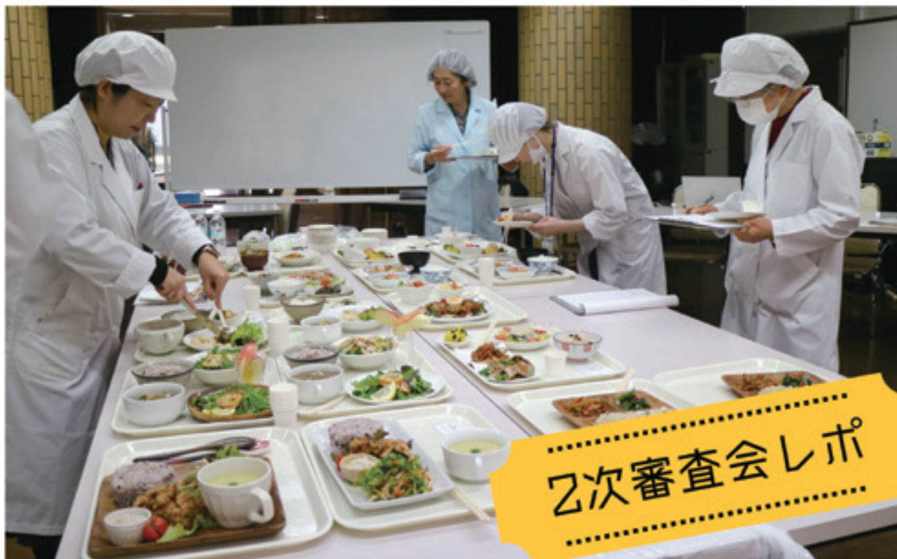
▲参加者によって調理された作品の試食審査中。